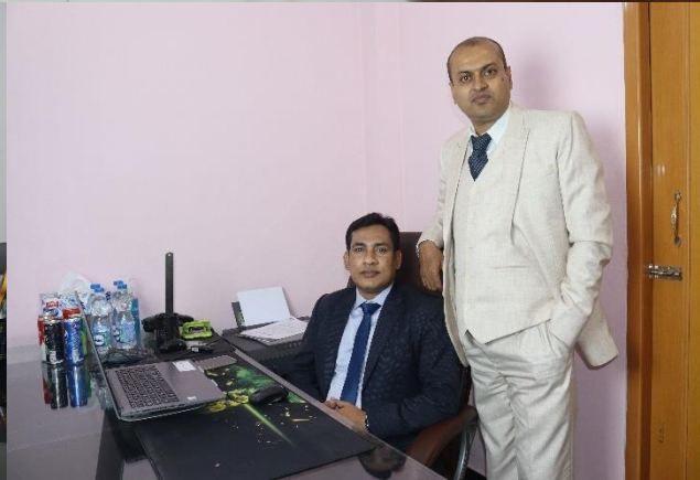
Picture: Office Employee