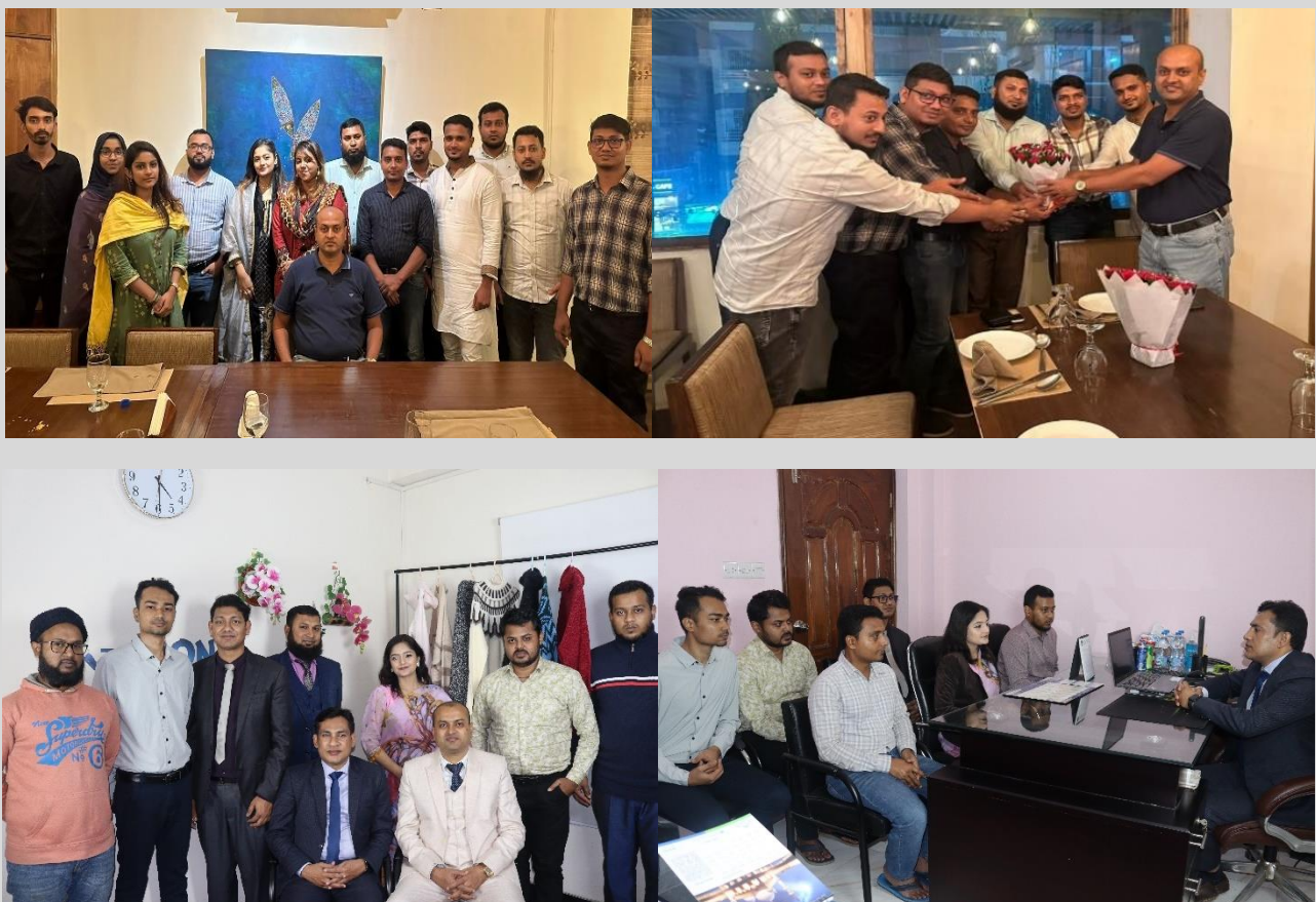
Picture: Program Photo

Our Program Photos showcase the positive impact of Zone Sparks initiatives, from outreach programs to educational endeavors.