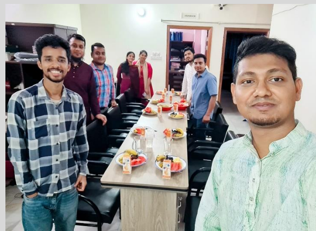
Picture: Dinner & Iftar Party